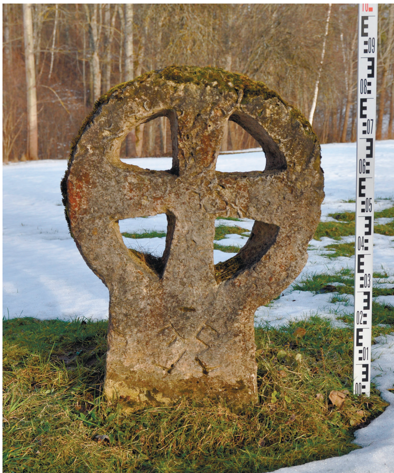
Рис. 3. Характерный для территории современной Латвии и Эстонии крест в круге в Aizkraukle

кто-то другой) таким необычным и не употребляемым в других местах способом обозначал место переправы в районе современного Даугавпилса. Вопрос о том, когда они были установлены в этом месте и из какого материала были изготовлены, остается открытым. По нашему мнению, это случилось не ранее конца XV в. – возможно, что во время похода московского войска в 1481 г. либо во время «войны коадьютеров» 1556–57 гг., в которой принимали участие немецкие наемники; а может, это было связано с гибелью купцов или знатных путников, переправлявшихся в этом месте через Западную Двину.