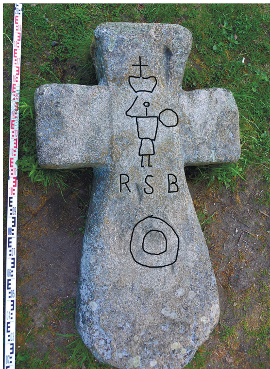
Рис. 4. Каменный крест в музее камней (Минск) (фото и прорисовка авторов)

можно встретить на захоронениях вдоль берегов различных рек, включая Западную Двину. И это нормально – вдоль рек всегда существовали поселения, в которых жили и умирали люди. Кроме того, важно отметить, что каменные кресты, отмечавшие захоронения или гибель людей около рек и озер, известны не только на территории Белоруссии, России и Балтии, но и в других странах. Так что поводов, по которым были установлены упоминаемые в донесении полоцкого воеводы кресты, может быть несколько, но ни одна из них, по нашему убеждению, к маркировке Витовтом или ливонцами перевоза (либо брода) через реку отношения не имеет.